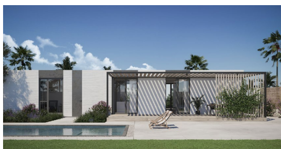
Mighty Houses - Cinco