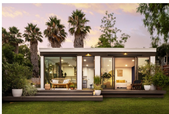
Mighty Mods - Mighty Duo B